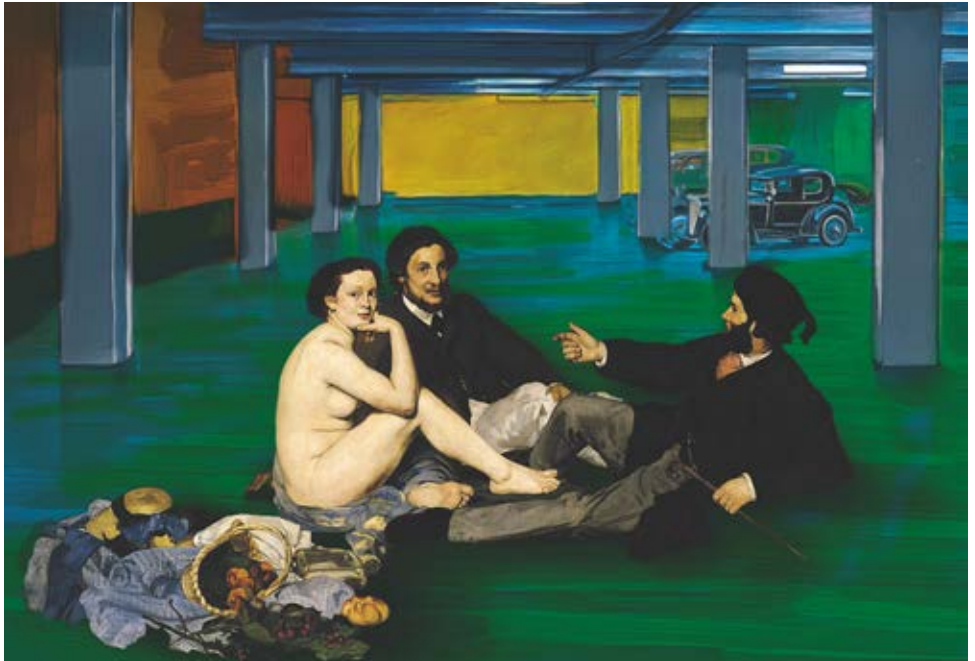
LE DÉJEUNER SUR BÉTON. Inspiré du Déjeuner sur l'herbe, Edouard Manet, 1863